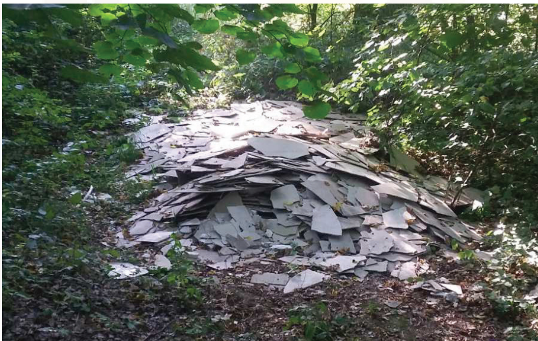
Příloha č. 2

Azbest můžete najít v nejrůznějších stavebních materiálech, od střešních krytin (tzv. eternit) přes potrubí kanalizačních stoupaček, opláštění vzduchotechnických rozvodů až po volně stojící zástěny ke kamnům nebo jako podložky pod starými elektrickými vypínači. Z azbestu mohou být izolační nástriky na stěnách nebo mezi zdmi a obložením budov.