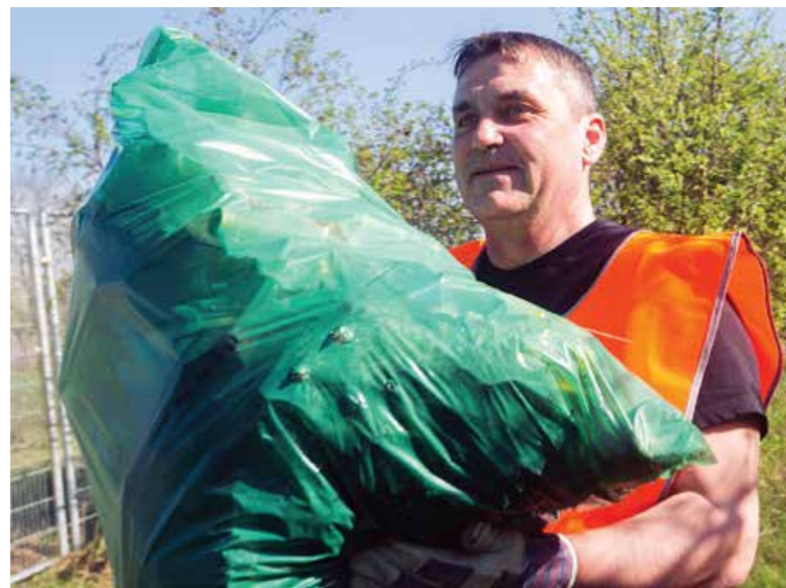
Richard Brabec ministr životního prostředí